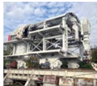
Укладчик для проходки боковых станционных тоннелей УС-01