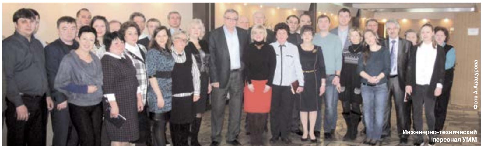
Инженерно-технический персонал УММ