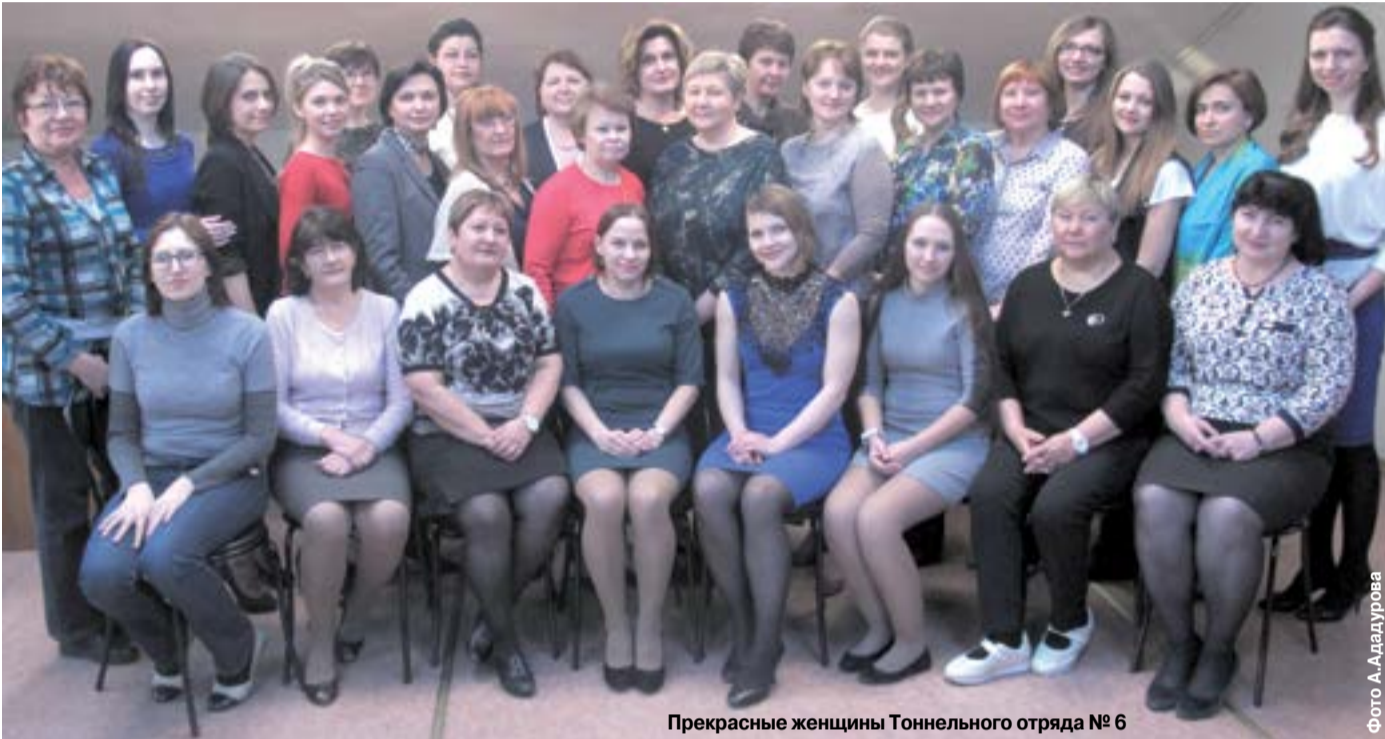
Прекрасные женщины Тоннельного отряда № 6