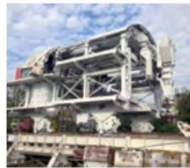
Укладчик для проходки боковых станционных тоннелей УС-01