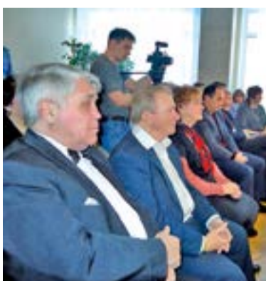
Ветераны КСУМа – гости праздника

Организаторами этой юбилейной встречи было предложено также интерактивное голосование по выбору