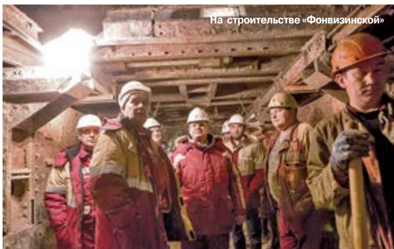
На строительстве «Фонвизинской»