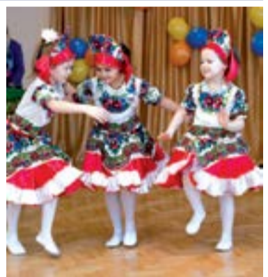
Юные артисты АНО «МИР ДЕТСТВА»