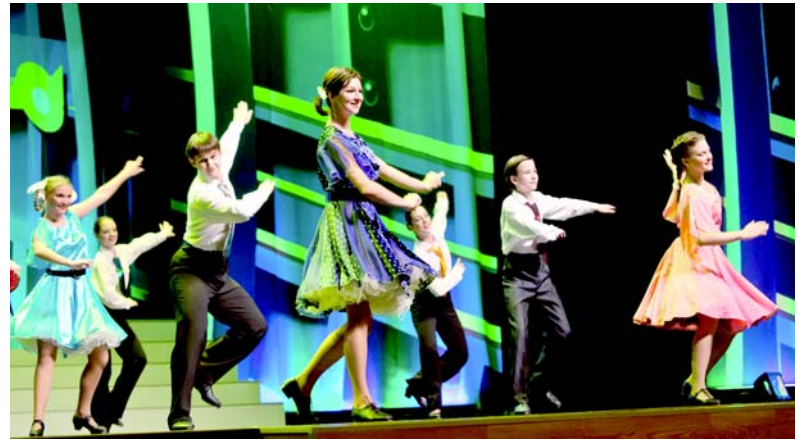
Ансамбль танца «Кудринка» из Дворца культуры Метростроя.

ну «от Волги до Енисея». А ведь метростроители и там отметились: в годы войны в нескольких волжских городах они строили оборонительные сооружения, потом было и метро в Нижнем Новгороде, а севернее Красноярска, под скалистыми берегами Енисея, был сооружен огромный подземный завод.