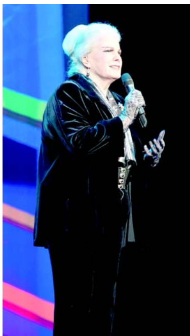
Народная артистка СССР Элина Быстрицкая.