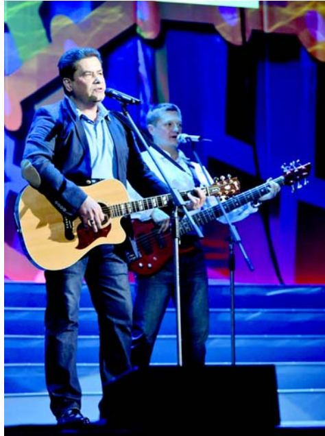
Народный артист России Николай Расторгуев.