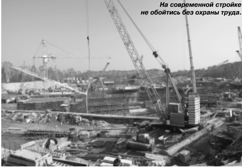
На современной стройке не обойтись без охраны труда.