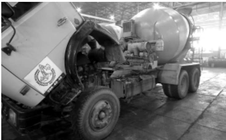
Чистота и порядок – залог безопасности.