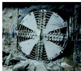
Конец проходки седьмого тоннеля.