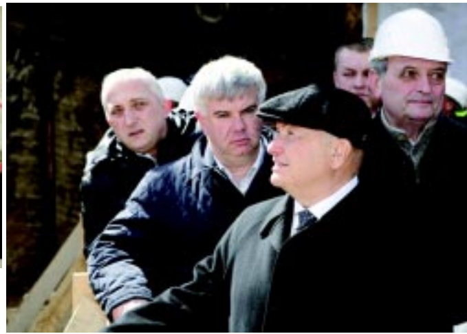
В этот момент происходит сбойка: «Ловат» Ингеокома выходит в станционный котлован.

мы продолжаем строить метро как самый важный вид транспорта для больших городов. Эта линия протянется сюда от Строгино на 6,5 километра. Уже в декабре на эту станцию должны прийти поезда метро, а мы потом пройдем ещё дальше — до станции «Пятницкая». И тогда транспортная задача для Митина будет полностью решена. В соответствии с планом, принятым Правительством Москвы, в этом году на строительство метро выделяется 46 миллиардов рублей. Это в несколько раз больше, чем, скажем, бюджеты некоторых регионов. Так что социальные программы мы не урезаем ни на копейку. По части метро будут строиться и эта, и другие линии. Мы это делаем с полным пониманием важности проблемы.