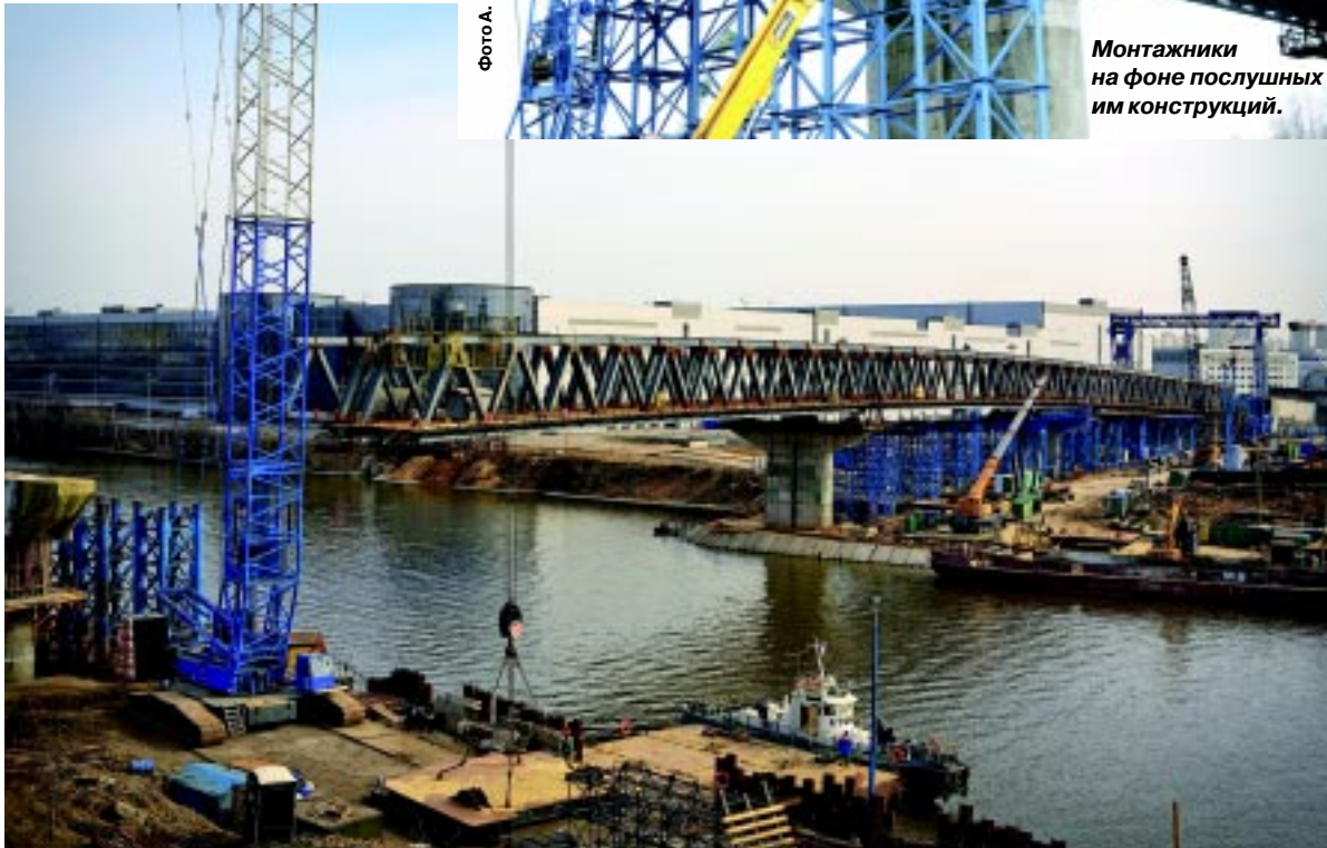
Монтажники на фоне послушных им конструкций.