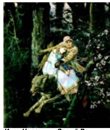
Иван Царевич и Серый Волк.

— Нам очень хотелось среди безликих многоэтажных коробок создать особый комплекс, где можно ощутить свои корни, узнать традиции предков,