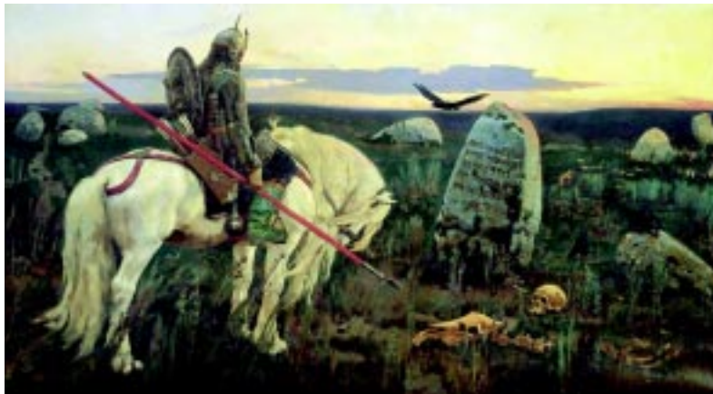
Витязь на распутье.

почувствовать атмосферу далекого прошлого. Когда-то во время наших завоеваний на Москву иноземных завоевателей, воины уходили на войну, а мирные жители старались держаться вместе именно здесь, в районе бывшей Мещанской слободы. Это были в основном ремесленники, иконописцы, строители. В XIX веке здесь очень активно селились купцы, которые делали немало пожертвований на храмы. Среди них был и купец Недыхляев, который построил свою усадьбу вблизи Подворья. Когда нам отдали его дом под музей и фонд, то дом был в руи-