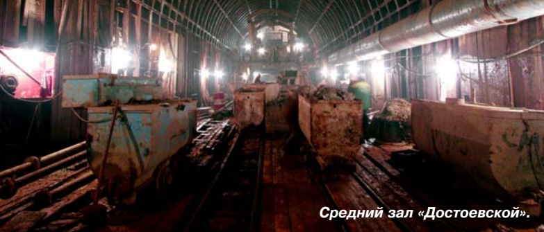
Средний зал «Достоевской».