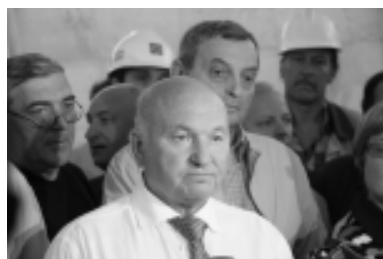
«Цветной бульвар». Общение с представителями прессы.

С платформы «Трубной» Ю.М. Лужков прошел по всему пересадочному узлу до среднего зала станции «Цветной бульвар», в том числе по неподвижному пока ступеням эскалатора малого наклона. На действующей станции его ожидали