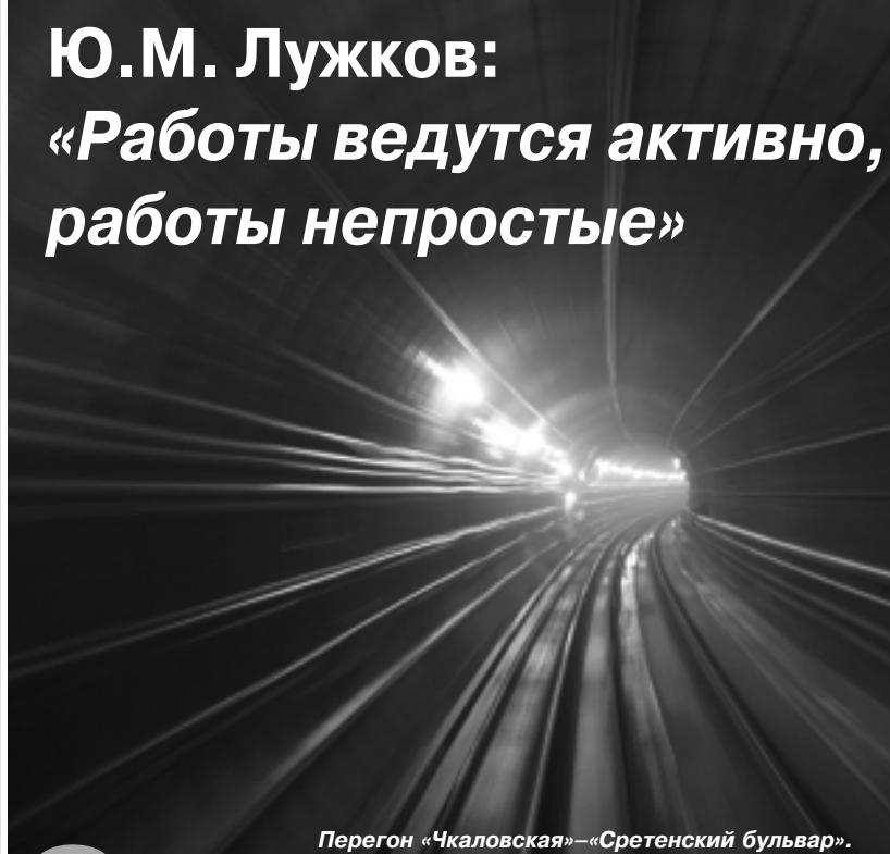
Перегон «Чкаловская»—«Сретенский бульвар».

События, связанные с продлением срока полномочий столичного мэра, когда голосование в городской думе уже прошло, а инаугурация еще предстояла, никак не повлияли на традиционное завершение рабочей недели Юрия Михайловича. В субботу, 30 июня, он, как обычно, посетил московские стройплощадки — побывал на второй очереди пешеходного моста, идущего от храма Христа Спасителя в сторону Якиманки, и познакомился с ходом строительства центрального участка Люблинско-Дмитровской линии метро. Вместе с руководителями Московского метростроя и Метрополитена и с группой членов правительства Москвы мэр проехал на открытой площадке мотовоза по новой подземной трассе — от «Чкаловской» до «Трубной».