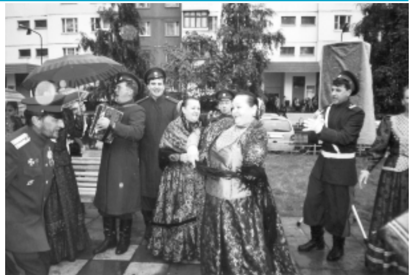
Казачий хор в гостях у жителей Новокосино.

Хочется надеяться, что вся эта красота, созданная в нашем дворе, не будет затоптана, разрушена, подвергнута вандализму... Люди, бере-