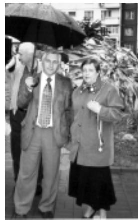
Красота – великая сила...