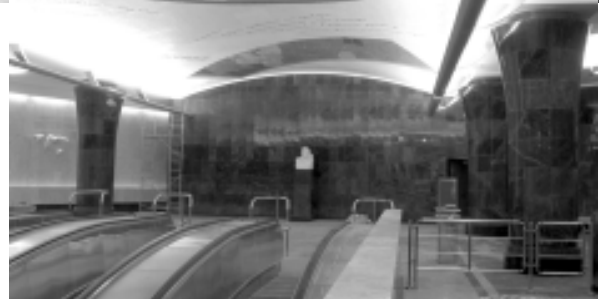
На строительстве вестибюля и наклонного хода станции «Трубная».

В настоящее время ваша организация успешно сооружает в центре