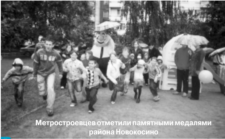
Метростроевцев отметили памятными медалями района Новокосино

Вот и пришел в Новокосино праздник «Наш двор». Почти два месяца жители общежития по улице Новокосинская, 49 и соседних домов наблюдали, как во дворе работали люди в ярких оранжевых куртках, как приезжали и уезжали огромные машины, грозно урчали грейдеры. Шла реконструкция, велось благоустройство дворовой территории. На глазах у всех обыденное и привычное превращалось в удивительное, виденное ранее только по телевизору: расцветал, озеленялся, обрстал спортивными сооружениями и детскими игровыми конструкциями наш двор.