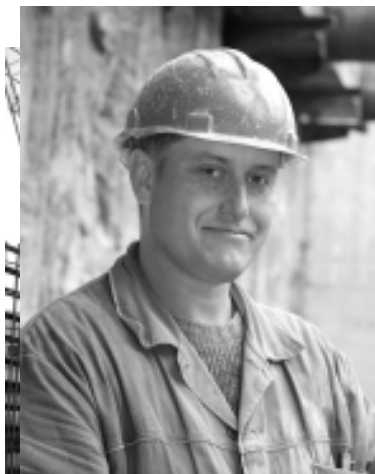
На 4-й секции участка открытого способа работ.