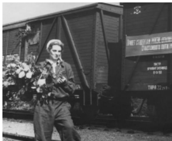
Отъезд на целину. 1956 год.