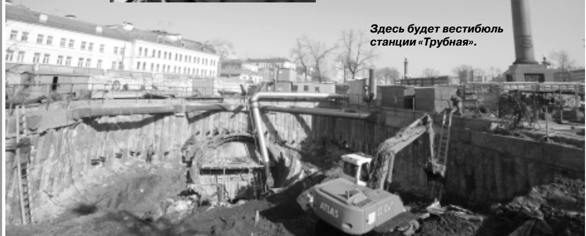
Здесь будет вестибюль станции «Трубная».