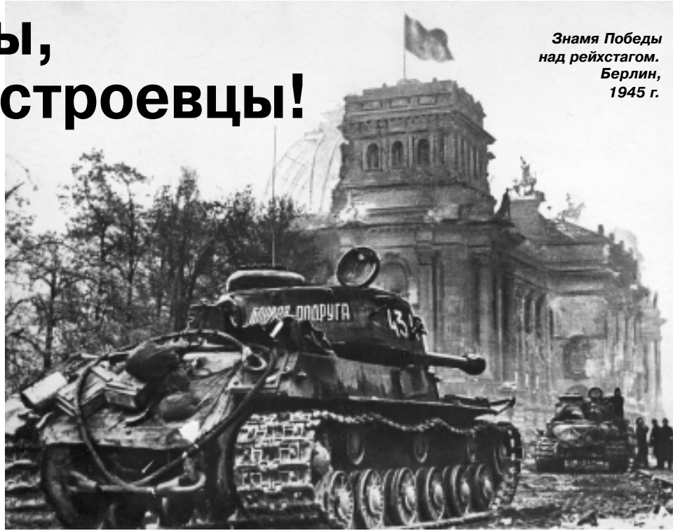
Знамя Победы над рейхстагом. Берлин, 1945 г.

Поздравляем с Днем Великой Победы всех тружеников Московского метрополитена!