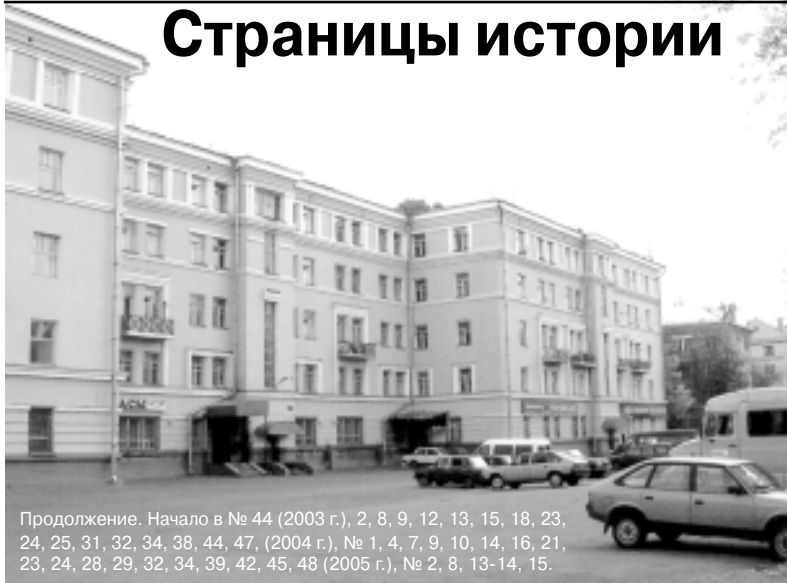
Продолжение. Начало в № 44 (2003 г.), 2, 8, 9, 12, 13, 15, 18, 23, 24, 25, 31, 32, 34, 38, 44, 47, (2004 г.), № 1, 4, 7, 9, 10, 14, 16, 21, 23, 24, 28, 29, 32, 34, 39, 42, 45, 48 (2005 г.), № 2, 8, 13-14, 15.

Т. В. Федорова. Из выступления на встрече в ЦК КПСС с ветеранами партии 16 августа 1983 г.: