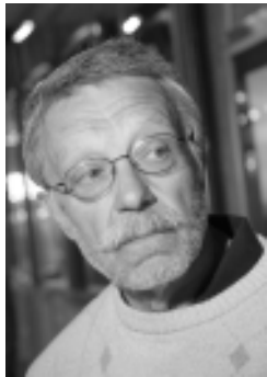
Фотограф и журналист Юрий Рост.

На станции «Деловой центр» 15 мая, в день рождения Московского метрополитена, которому исполнился 71 год, была открыта новая фотовыставка известного фотографа и журналиста, обозревателя «Новой газеты» Юрия Роста — «Птицы». Это уже не первая экспозиция в галерее «Метро», размещившейся вдоль пешеходного балкона над путями новой станции метро. Первая — «Предъявление мира» — была открыта в декабре прошлого года и включила в себя лучшие фотопейзажи и уникальные по красоте авторские работы Юрия Роста.