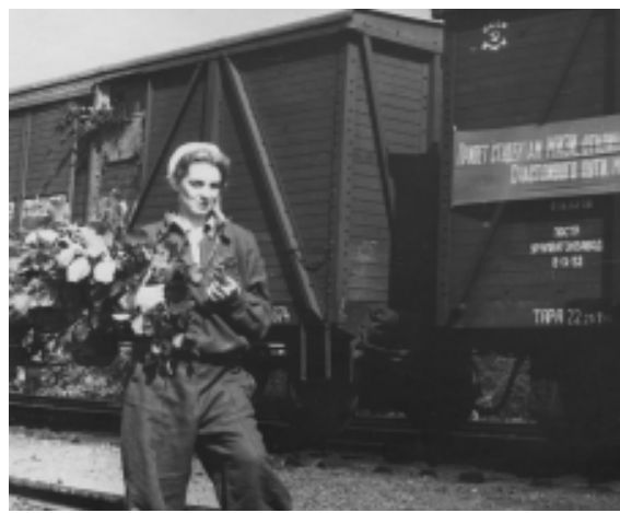
Отъезд на целину. 1956 год.