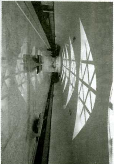
Светлая платформа «Строгино».