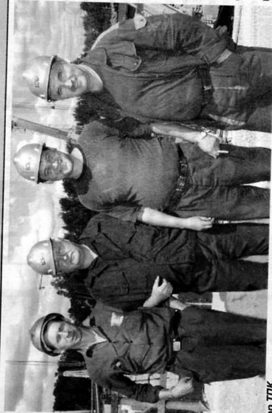
Ротор ТПК «Ловат» вышел в демонтажную камеру.

Кстати сказать, журналистам тот день предстояло возможность убедиться воочию в точности сбоек. Поскольку в надстройку на четыре яруса вверх демон-